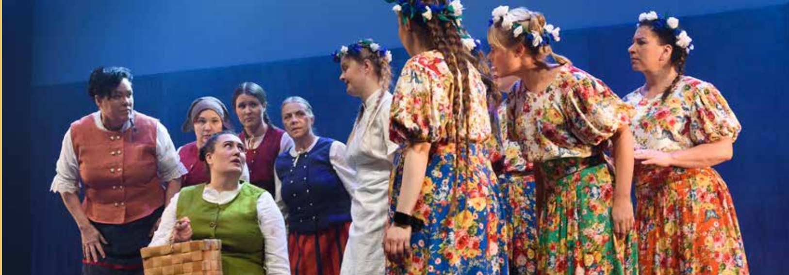
Teksti Jukka Kumpulainen