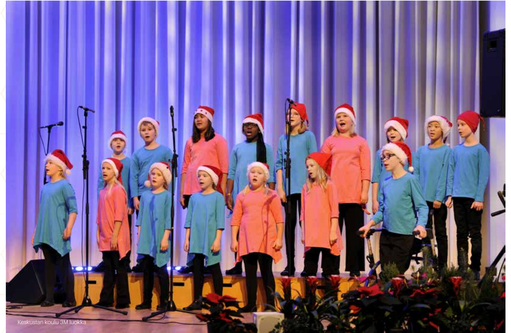
Keskustan koulu 3M luokka