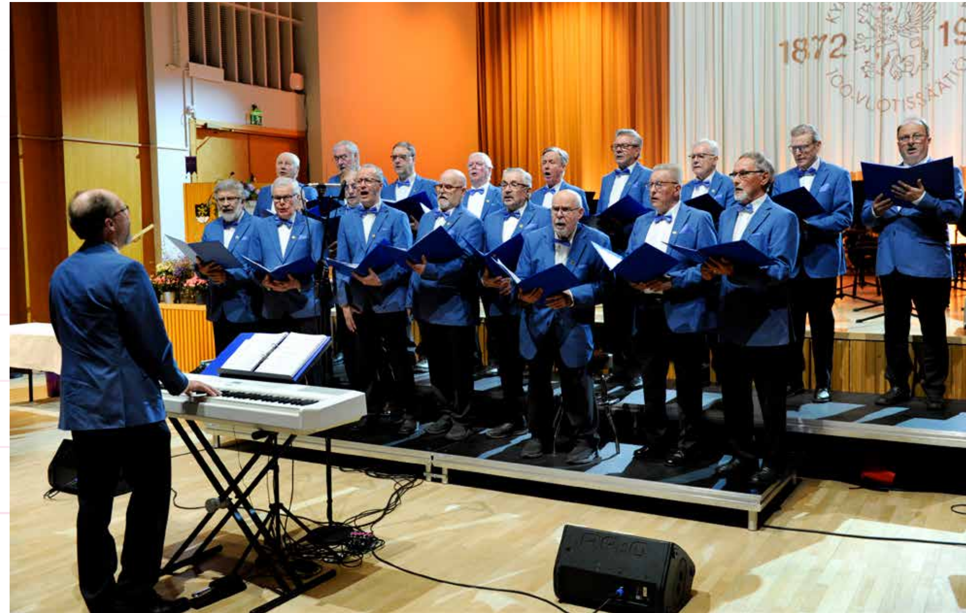
Myllykosken Metallimiesten kuoro

Harrastus- ja virkistystoimintaan on myönnetty apurahoja 488.900 euroa, joka on sääntöjen mukaisella tasolla ollen alle viidennes edellisen tilivuoden nettotulojen 80 prosentin osuudesta.