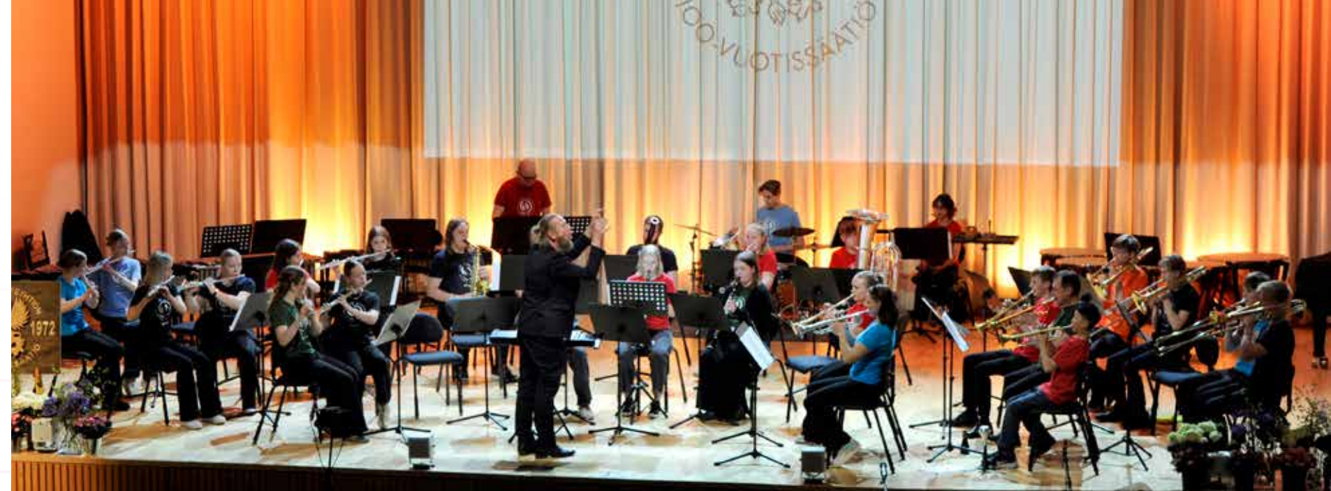
Pohjois-Kymen musiikkiopiston Kymi Wind Band

Osinko- ja korkotuottoja säätiö sai 4,2 milj. euroa (4,1 milj. euroa vuonna 2024). Osinkotulot pysyivät edellisen vuoden tasolla. Osinkotulojen vakaa tuotto on mahdollistanut apurahojen tasaisen jakamisen.