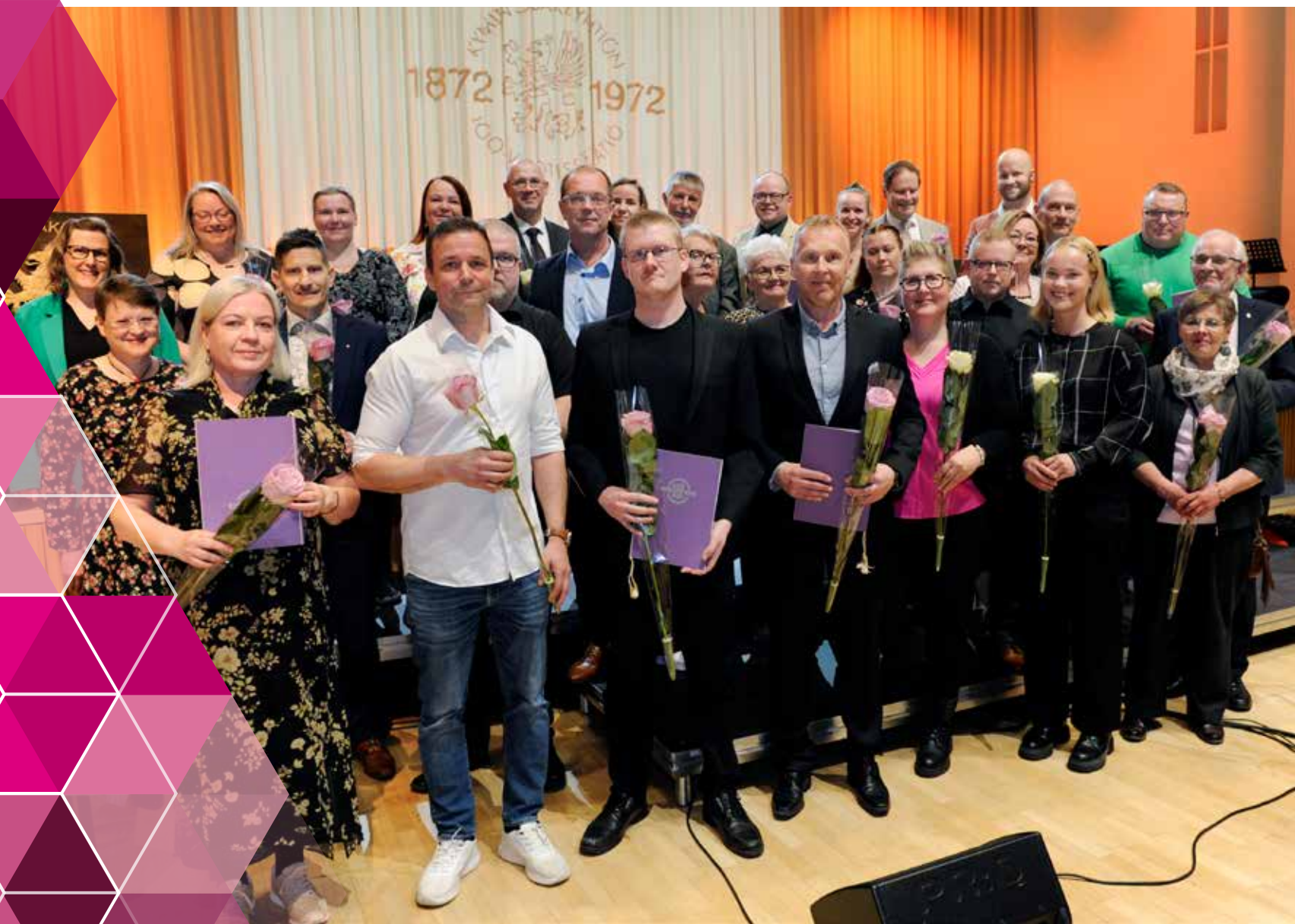
Erityisapurahan saajat 2025