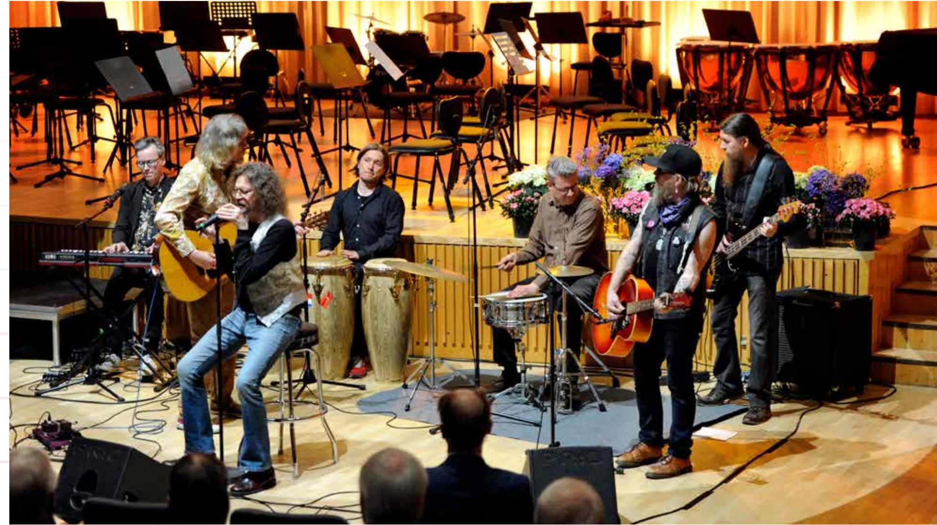
The Barefoot Brothers