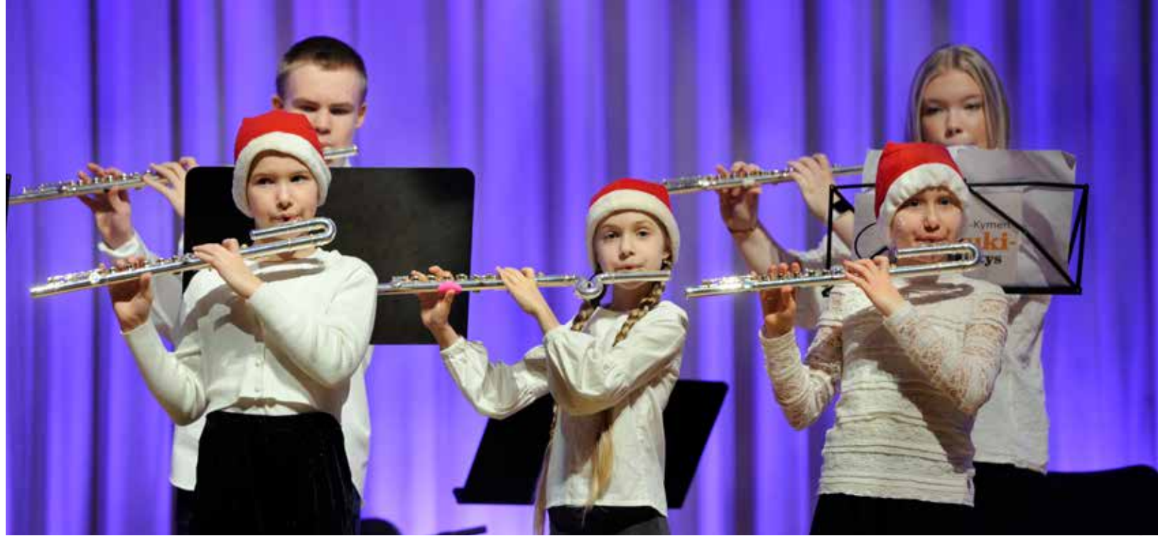
Pohjois-Kymen musiikkiopiston suzukihiuluryhmä